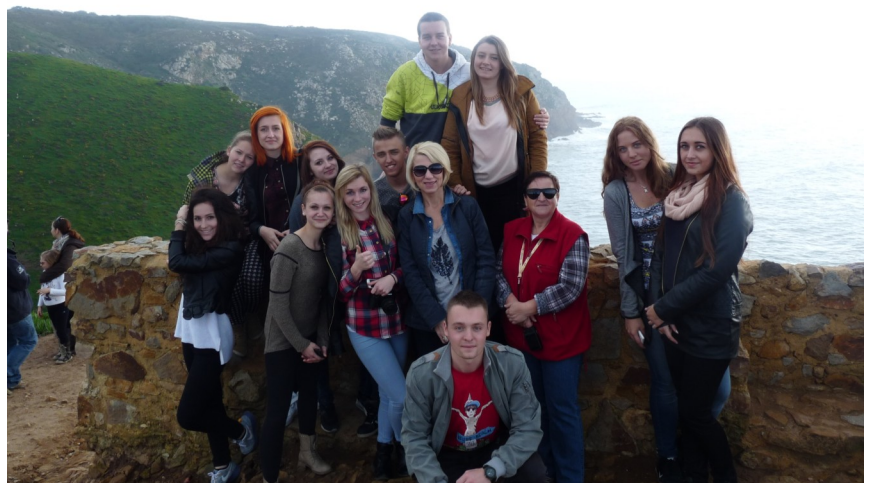
Grupa portugalska na Cabo da Raco

Uczestnictwo w projekcie pozwoliło uczniom rozwijać umiejętność praktycznego wykorzystania języka angielskiego, w szczególności w zakresie słownictwa branżowego. Była to okazja do pobudzenia kreatywności i przedsiębiorczości uczestników, rozwijania ich umiejętności współdziałania w grupie, zdolności adaptacji do specyficznych warunków pracy w odmiennym kulturowo środowisku, a także zwiększenia poczucia pewności siebie w życiu codziennym i samodzielności w sytuacjach zawodowych. Trzy grupy szczęśliwców wyłonione zostały w wyniku procesu rekrutacji, w ramach którego uczniowie wypełniali formularz aplikacyjny, pisali list motywacyjny, test z przedmiotów zawodowych oraz z języka angielskiego, a także uczestniczyli w rozmowie kwalifikacyjnej, prowadzonej w języku angielskim.