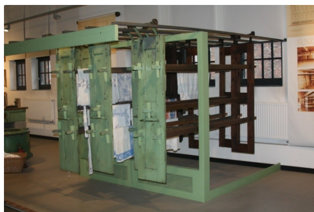
Zachęcamy Was do spaceru po Nikiszowcu :)"

Nie tylko świąteczny kiermasz na Nikiszowcu robi wrażenie. My korzystając z okazji zwiedziliśmy osiedle a prowadził nas audio przewodnik. Taki przewodnik jest dostępny w punkcie informacji turystycznej na Nikiszowcu. Spacer zakończyliśmy w Muzeum Historii Katowic zlokalizowanym w byłej miejskiej pralni. Zobaczyliśmy w jaki sposób gospodynie nikiszowskiego osiedla prały oraz jak wyglądało typowe mieszkanie śląskie. Warto tutaj wspomnieć, że właściciel osiedla zabronił robić pranie w mieszkaniach w obawie przed zawilgoceniem pomieszczeń.