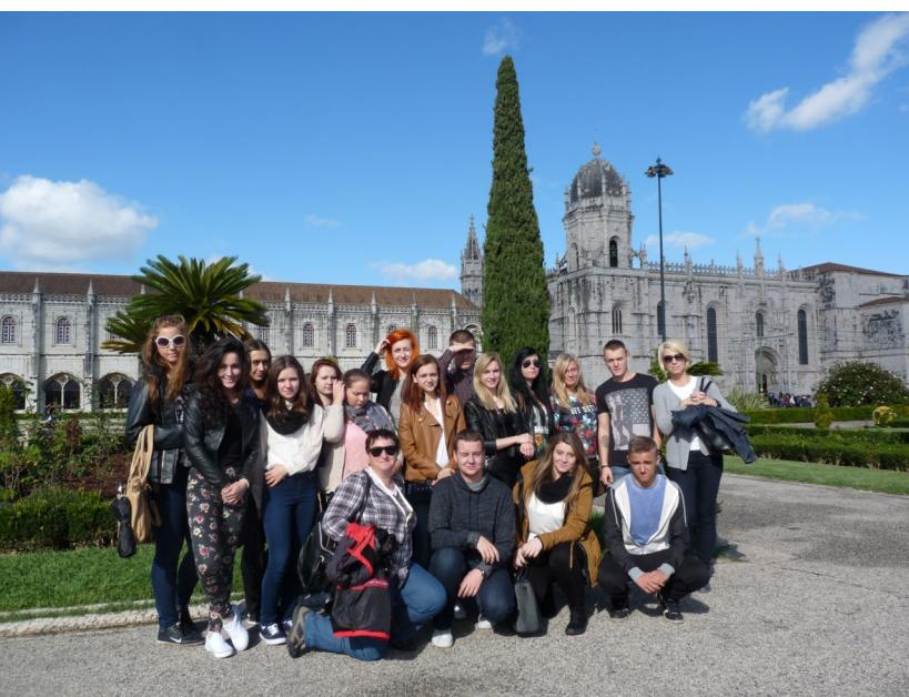
Grupa portugalska w Belem

Uczestnictwo w projekcie pozwoliło uczniom rozwijać umiejętność praktycznego wykorzystania języka angielskiego, w szczególności w zakresie słownictwa branżowego. Była to okazja do pobudzenia kreatywności i przedsiębiorczości uczestników, rozwijania ich umiejętności współdziałania w grupie, zdolności adaptacji do specyficznych warunków pracy w odmiennym kulturowo środowisku, a także zwiększenia poczucia pewności siebie w życiu codziennym i samodzielności w sytuacjach zawodowych. Trzy grupy szczęśliwców wyłonione zostały w wyniku procesu rekrutacji, w ramach którego uczniowie wypełniali formularz aplikacyjny, pisali list motywacyjny, test z przedmiotów zawodowych oraz z języka angielskiego, a także uczestniczyli w rozmowie kwalifikacyjnej, prowadzonej w języku angielskim.