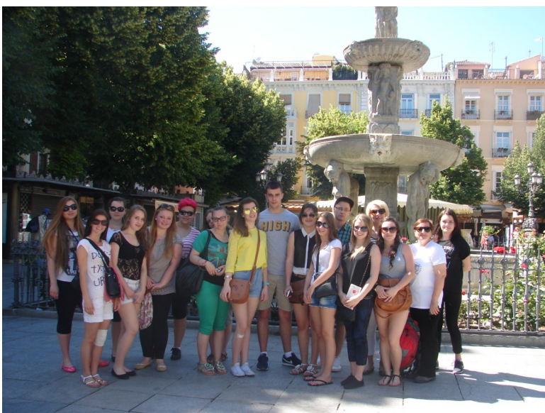
Grupa pierwsza hiszpańska w Granadzie

W czasie weekendów realizowany był bogaty program kulturalny, dzięki któremu uczniowie poznali wspaniałe zabytki Granady, o której sami Hiszpanie mówią, że kto nie widział Granady, nic nie widział. Zobaczyli m.in. Alhambrę, arabską dzielnicę Albaicin i cygańską dzielnicę Sacromonte z jej jaskiniami, w których