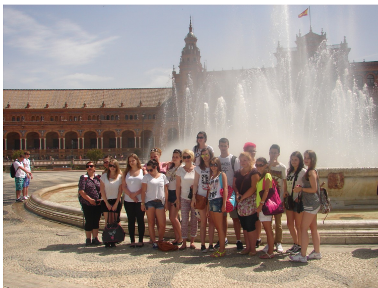
Grupa pierwsza hiszpańska w Seville

W Lizbonie uczniowie pracowali w wysmienionych restauracjach, gdzie poznawali kuchnię śródziemnomorską, japońską i francuską, w hotelach i hostelach oraz biurach podróży. Wszędzie tam szlifowali swój język angielski, wzbogacali znajomość języka portugalskiego, uczyli również swoich portugalskich kolegów z pracy polskich zwrotów. Stażyści mieszkali w dwuosobowych, wygodnych pokojach Hotelu Nacional, który znajduje się w centrum miasta, niedaleko stacji metra. Metro na cztery tygodnie stało się głównym środkiem transportu dla wszystkich stażystów. W weekendy poznawali wspaniałe zabytki Lizbony, liczne muzea, dzielnicę Belem, wraz z jej klasztorem Hieronimitów, wieżą Belem oraz pomnikiem Odkrywców. Zjedli tam znane na cały świat pyszne ciasteczka Pasteis de Belem.